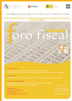
Número 8 1er Semestre 2009

Pulse en la imagen para descargarse Revista en formato .pdf