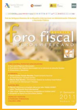
Número 13 2º Semestre 2011