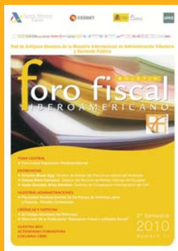
Número 11 2º Semestre 2010