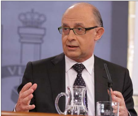
El ministro de Hacienda y Administraciones Públicas de España, Cristóbal Montoro

butaria e incorporarse España al Mercado Único europeo.