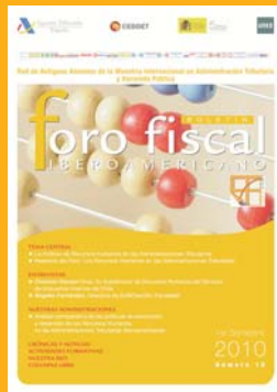
Número 10 1er Semestre 2010