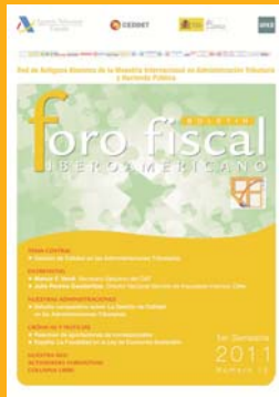
Número 12 1er Semestre 2011