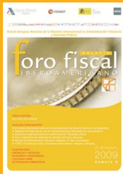
Número 9 2º Semestre 2009