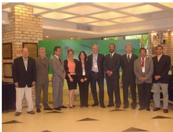
Asamblea del CIAT, patrocinadores, profesores y alumnos de las tres ediciones de la Maestría