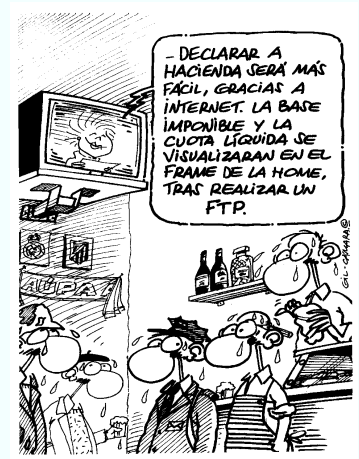
Por Sir Cámara en www.datadiar.com

Por Carol Martinoli carol_martinoli@yahoo.es